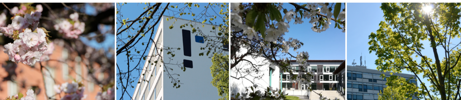
Frühlingsgrüße von den Standorten