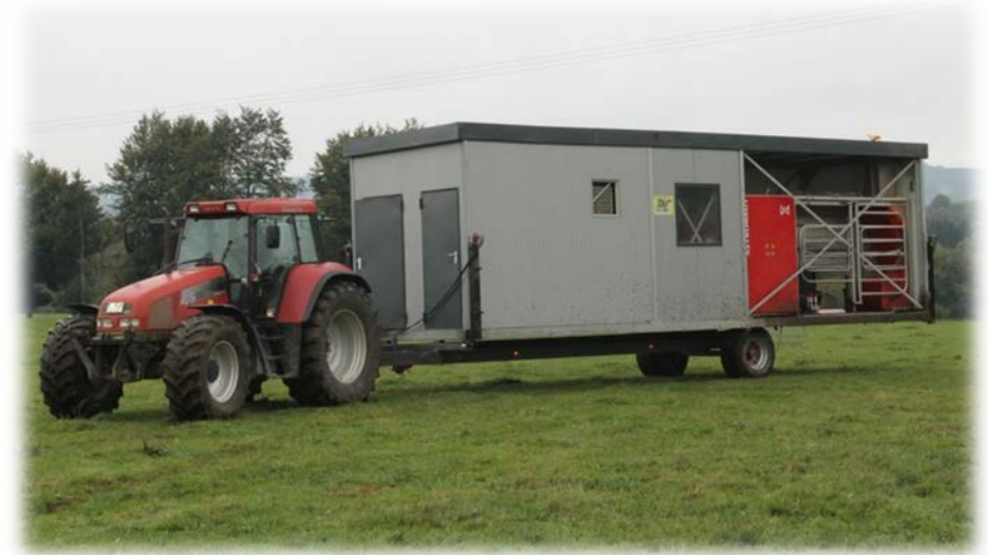
Abbildung 1: Transport des Melkroboters im Container

In Zusammenarbeit mit einer Agrartechnik-Firma wurde ein eigens dafür konzipierter Container gebaut, in dem der Melkroboter, der Milchtank und ein kleines Büro Platz finden (Abb.1).