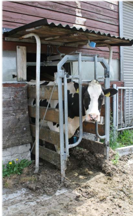
Abbildung 4: Selektionstor zur Weide

Bei freiem Zugang zum AMS lohnt es sich, ein mit dem Melkroboter gekoppeltes, druckluftgesteuertes Selektionstor (Abb. 4) am Ausgang vom Stall zur Weide zu platzieren. Die Tiere werden dort über den gleichen Transponder erkannt wie am Melkroboter und erhalten Zugang zur Weide wenn sie kein (baldiges) Melkanrecht haben. Wie der Landwirt Guido Simon, der dieses System praktiziert, im Rahmen des Workshops berichtete, lernen die Tiere relativ schnell, dass sie erst durch den